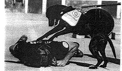
Proje kapsamında sokak hayvanlarından gönüllü arama kurtarma timi oluşturulması ve bunları eğitecek kişilerin yetiştirilmesine yönelik projede dördüncü dönem başlıyor.

Antalya Büyükşehir Belediyesi ve Alman Care-4 Life kuruluşunun işbirliğiyle düzenlenen sokak köpeklerinden arama kurtarma köpeği timi oluşturulması ve bunları eğitecek kişilerin yetiştirilmesine yönelik projede dördüncü dönem başlıyor. Proje kapsamında oluşturulacak ilk gönüllü arama kurtarma timi sonbaharda görevde olacak.