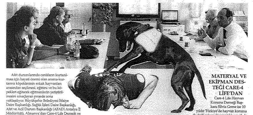
Afet durumlarda canlıların kurtarılması için hayati önemi olan arama-kurtarma köpeklerini sokak hayvanları arasından seçilmesi, eğitimi ve bu köpekleri eğitecek eğitimcilerin yetiştirilmesini amaçlayan projede sona yaklaşıyor. Büyükşehir Belediyesi İtfaiye Daire Başkanlığı, Sağlık İşleri Daire Başkanlığı, Afet ve Acil Durum Başkanlığı (AFAD) Antalya İl Müdürlüğü, Almanya'dan Care-4 Life Derneği ve SAR Germany işbirliğiyle gerçekleştirilen projenin

Antalya Büyükşehir Belediyesi ve Alman Care-4 Life kuruluşunun işbirliğiyle düzenlenen sokak köpeği arama kurtarma köpeği timi oluşturulması ve bunları eğitecek kişilerin yetiştirilmesine yönelik projede dördüncü dönem başlıyor. Proje kapsamında oluşturulacak ilk gönüllü arama kurtarma timi sonbaharda görevde olacak.